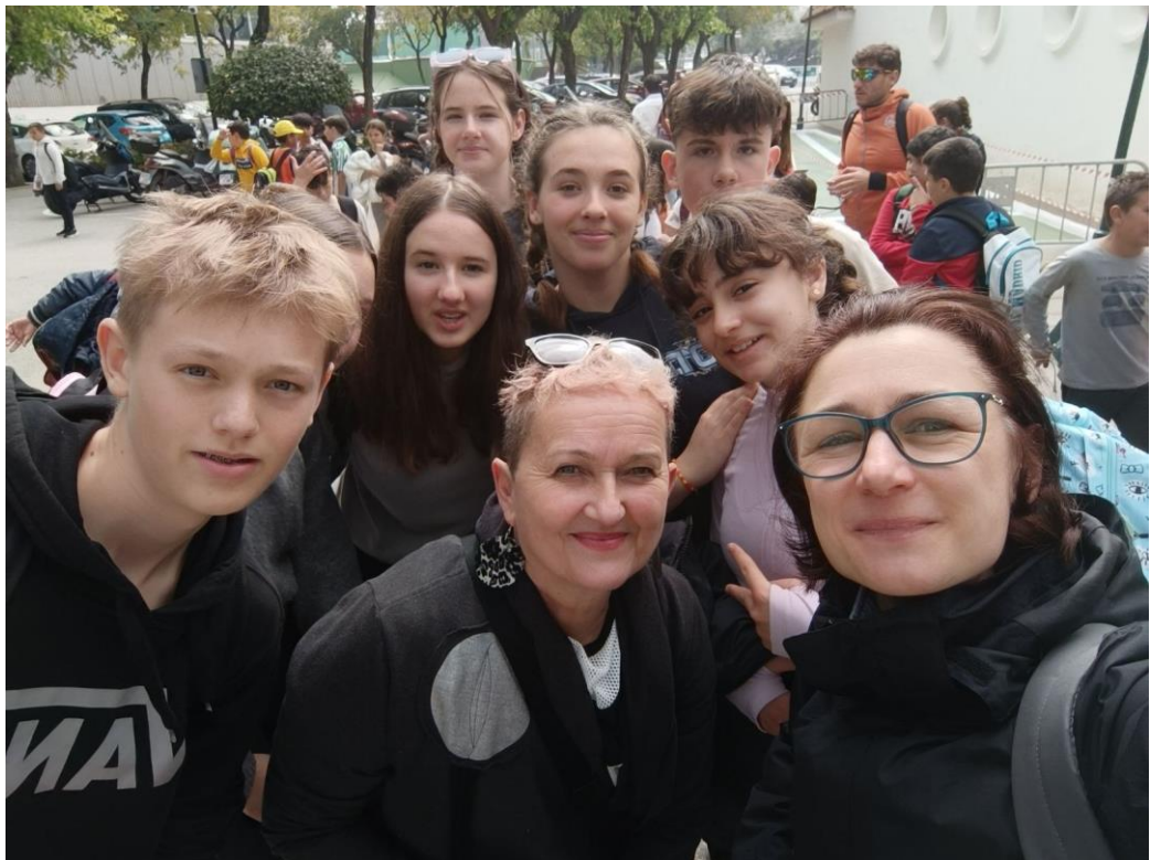
Dan smo zaključili z ogledom znamenitosti v Seville.